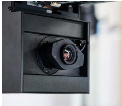
Kamerasystem auf Basis eines CMOS-Sensors