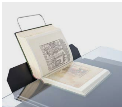
Verschiedene Buchstützen optional verfügbar