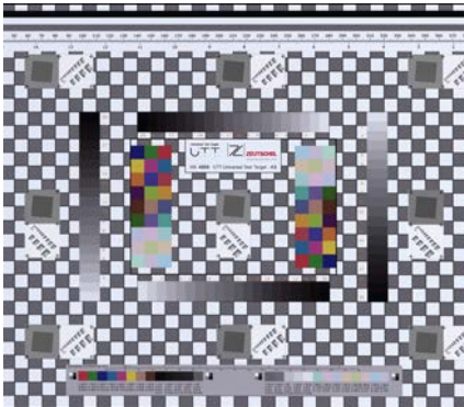
Erfüllt die Standards ISO 19264-1 Level A, Metamorfoze Full und FADGI 4 Star