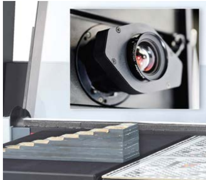
Hohe Tiefenschärfe – elektronisch verstellbare Blende