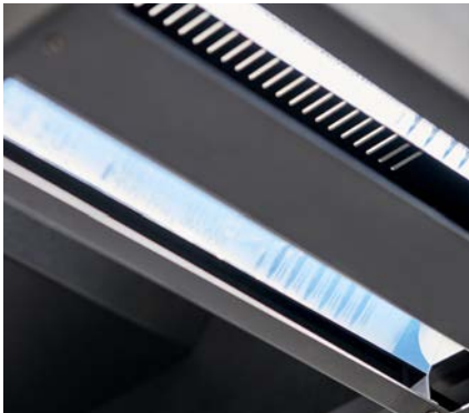
LED-Beleuchtungssystem für reflex- und schattenfreie Ergebnisse